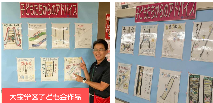
大宝学区子ども会作品

大宝学区子ども会の皆さんが描いてくれたポスターの掲示期間は終わりましたが、大人が率先して立ち止まることを意識したいものです。