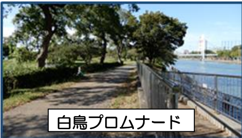
白鳥プロムナード

名古屋市では、名古屋国際会議場の大規模改修に連携して、隣接する白鳥公園と堀川・白鳥プロムナードのリニューアルに令和7年度より着手し、地域の魅力を高めていきたいと考えています。リニューアルにあたり、地域の皆様や利用者のニーズを把握するためのアンケートを実施しますので、ご協力をよろしくお願いします。 【名古屋市緑政土木局作成】