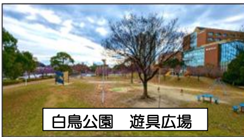
白鳥公園 遊具広場