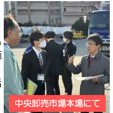
中央卸売市場本場にて