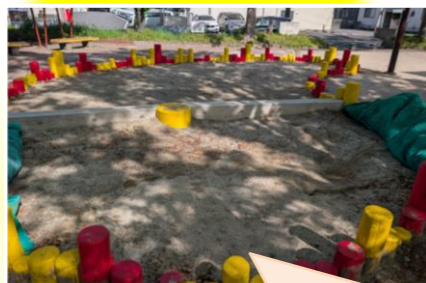
本年内に新ネットを設置