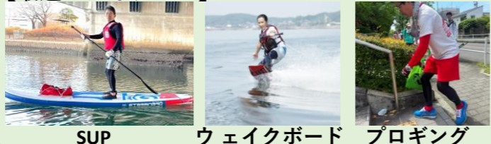
SUP ウェイクボード プロギンク